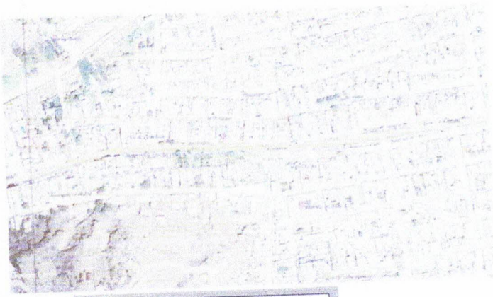
VISTA SATELITAL DEL PARQUE GRAU