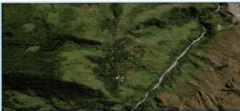
Imagen N°05: Micro localización – Localidad de HUANCHAG