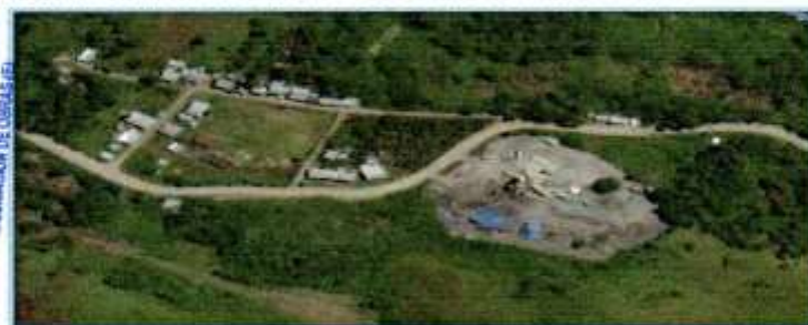
Imagen N°03: Micro localización – Localidad de HIDRONPAMPA