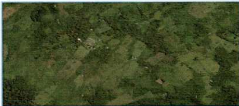
Imagen N°04: Micro localización – Localidad de SAN MARTIN DE PORRAS