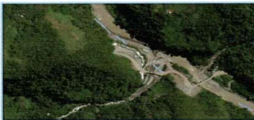
Imagen N°06: Micro localización – Localidad de MALLGO TINGO