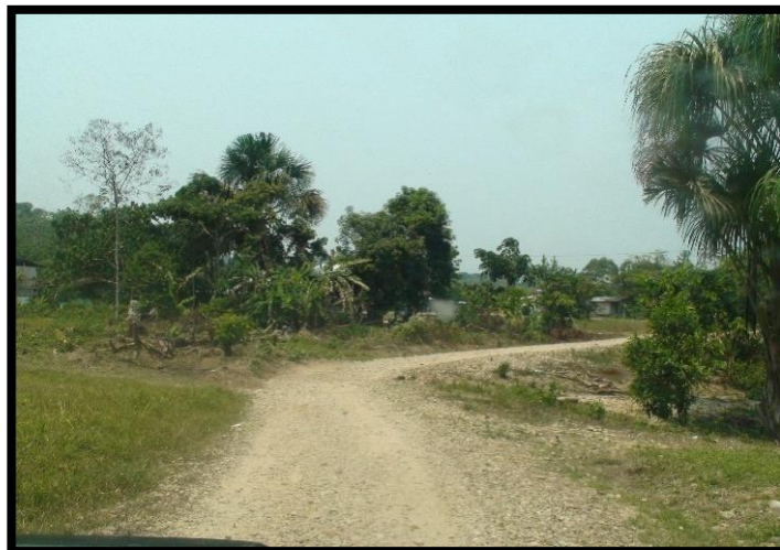
Fig. N° 02, Vista del Acceso al caserío Nuevo Porvenir de Pacaya.