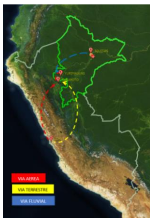
FIGURA.2 Mapa de vías de acceso a la ciudad de Yurimaguas.

Yurimaguas – Lagunas: 12 horas (navegación de día y de noche, en Motonave de capacidad de 90 Ton), contando como vía principal de acceso el río Huallaga aguas abajo.