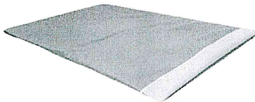
Fig. 1 (No incluye diseño)