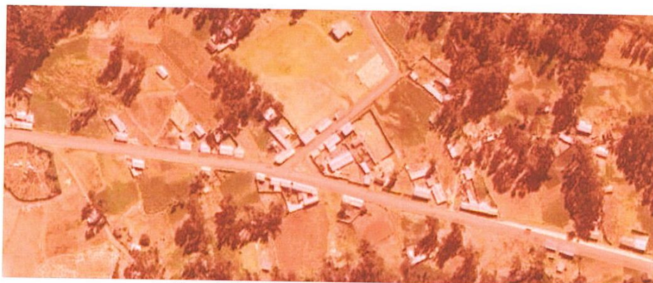
Mapa de Ubicación del centro poblado Auquimarca