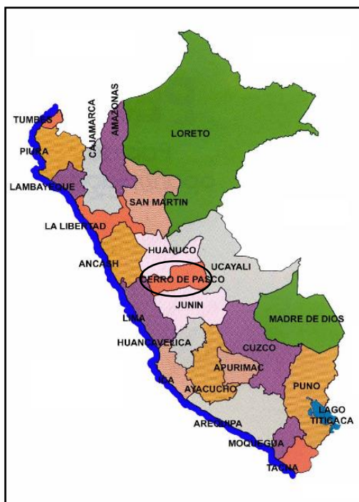
Figura 1: Ubicación Nacional

El proyecto materia del presente informe, se encuentra ubicada en centro poblado de San Isidro de Yanapampa del Distrito de TICLACAYÁN, Provincia de Pasco, Departamento de Pasco, donde la altitud es 3380 m.s.n.m.