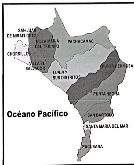
Imagen N° 02 Mapa del Distrito de Punta Negra

MUNICIPALIDAD DISTRITAL PUNTA NEGRA OFICINA GENERAL DE ADMINISTRACIÓN Y FINANZAS OFICINA DE LOGÍSTICA Y CONTROL PATRIMONIAL