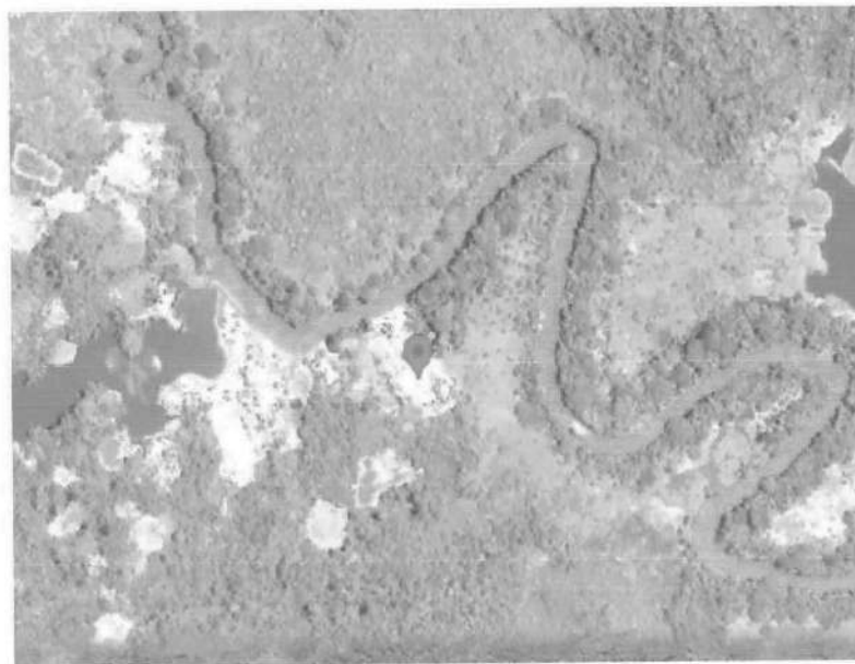
Figura 02: ubicación de la comunidad Nueva Alegria