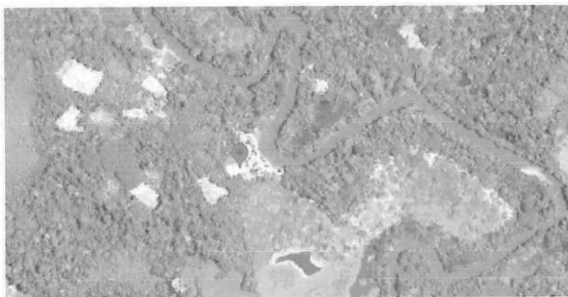
Figura 02: ubicación de la comunidad Puerto Chuinda