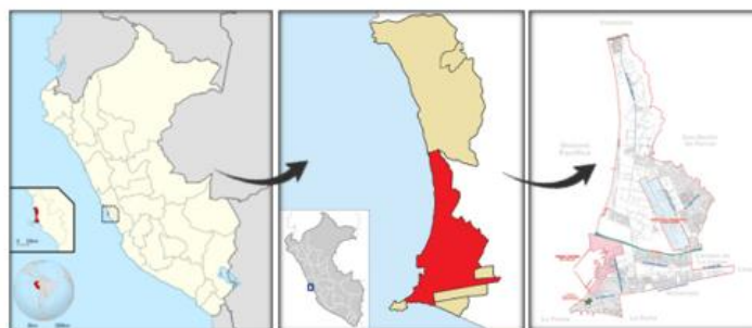
IMAGEN 01: UBICACIÓN GEOGRÁFICA DE LA PROVINCIA DEL CALLAO

El terreno, de la obra: "MEJORAMIENTO DEL SERVICIO DE MOVILIDAD URBANA EN SECTOR 1 DE LA ZONA MONUMENTAL DEL CALLAO, DISTRITO DE CALLAO DE LA PROVINCIA CONSTITUCIONAL DEL CALLAO DEL DEPARTAMENTO DE CALLAO"; se encuentra ubicado en la provincia Constitucional del Callao, departamento de Callao, como se visualiza en la siguiente imagen: