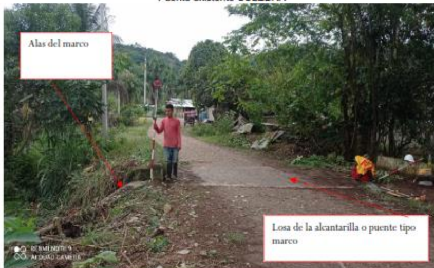
Puente existente CULEBRA