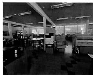
Figura 17: 2do Piso - bloque N° 01 Gerencia de Desarrollo Urbano y Catastro