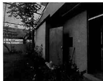
Figura 11: 1er Piso - bloque N° 01 Almacén de utensilios de limpieza