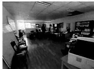
Figura 22: 3er Piso - bloque N° 01 Interior de la oficina de Sub gerencia de educacion, cultura y deportes