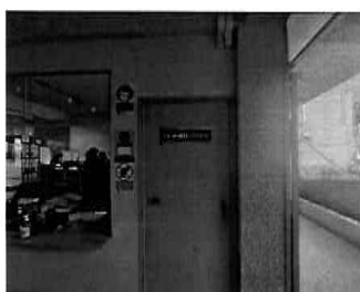
Figura 06: 1er Piso - bloque N° 01 Sub Gerencia de Obras Privadas