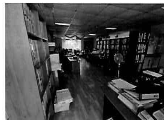
Figura 24: 3er Piso - bloque N° 01 Interior de la Unidad Formuladora, Oficina de programación multianual-OPMI