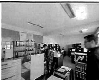
Figura 07: 1er Piso - bloque N° 01 Interior de la oficina de Obras Privadas