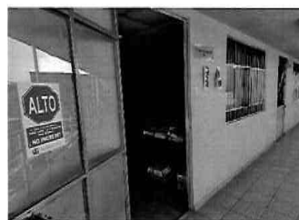
Figura 23: 3er Piso - bloque N° 01 Unidad Formuladora, Oficina de programación multianual-OPMI