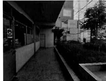
Figura 10: 1er Piso - bloque N° 01 Servicios higiénicos para caballeros