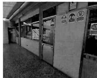
Figura 16: 2do Piso - bloque N° 01 Exterior de la Gerencia de Desarrollo Urbano y Catastro