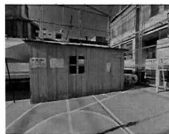
Figura 12: 1er Piso - bloque N° 01 Area de salud y seguridad en el trabajo