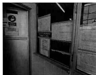
Figura 14: 2do Piso - bloque N° 01 Atención de la Sub Gerencia de Planeamiento y Habilitaciones Urbanas