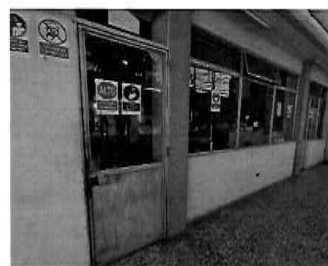
Figura 18: 2do Piso - bloque N° 01 Gerencia de Desarrollo Urbano y Catastro