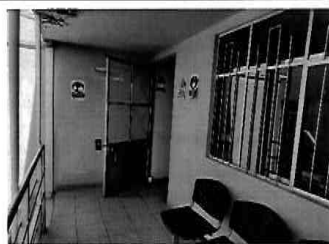
Figura 21: 3er Piso - bloque N° 01 Sub gerencia de educacion, cultura y deportes