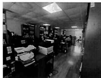
Figura 30: 3er Piso - bloque N° 01 Interior de la oficina de Procuraduría pública municipal