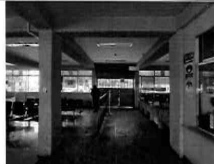
Figura 02: 1er Piso - bloque N° 01 Área de entrada principal