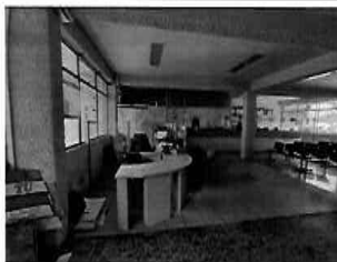
Figura 01: 1er Piso - bloque N° 01 Área de cajas de pago