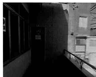
Figura 20: 2do Piso - bloque N° 01 Servicios higiénicos para damas