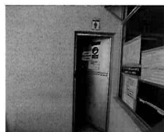
Figura 19: 2do Piso - bloque N° 01 Servicios higiénicos para caballeros