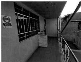
Figura 29: 3er Piso - bloque N° 01 Procuraduría pública municipal