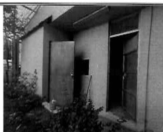
Figura 08: 1er Piso - bloque N° 01 Almacén de obras privadas