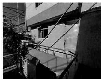
Figura 13: 2do Piso - bloque N° 01 Almacén de la Sub Gerencia de Planeamiento y Habilitaciones Urbanas