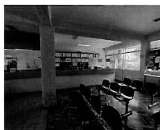
Figura 04: 1er Piso - bloque N° 01 Se ubica el área de mesa de partes