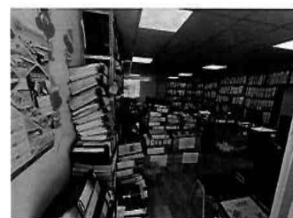
Figura 26: 3er Piso - bloque N° 01 Interior de la oficina de la Sub gerencia de Estudios y Proyectos