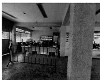
Figura 03: 1er Piso - bloque N° 01 Sub gerencia de licencias autorizaciones e ITSE