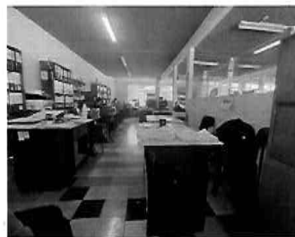
Figura 15: 2do Piso - bloque N° 01 Sub Gerencia de Planeamiento y Habilitaciones Urbanas