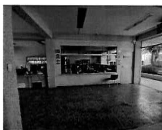
Figura 05: 1er Piso - bloque N° 01 Área de atención de obras privadas