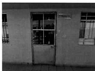
Figura 25: 3er Piso - bloque N° 01 Sub gerencia de Estudios y Proyectos