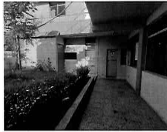
Figura 09: 1er Piso - bloque N° 01 Servicios higiénicos para damas