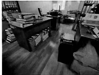
Figura 27: 3er Piso - bloque N° 01 Interior de la oficina de la Sub gerencia de Estudios y Proyectos