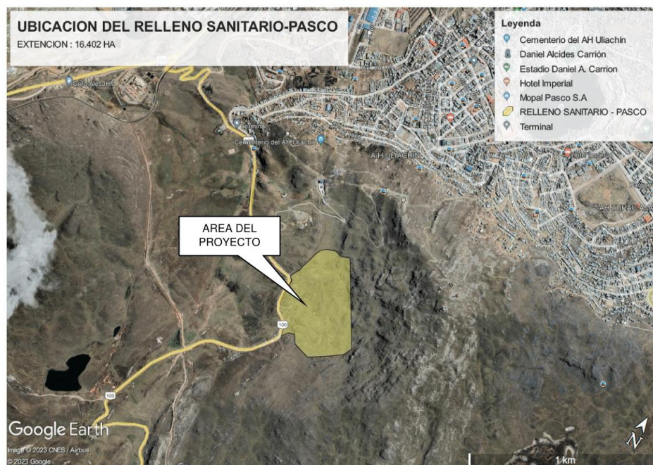
Figura 2. Ubicación – Localización del terreno del Proyecto