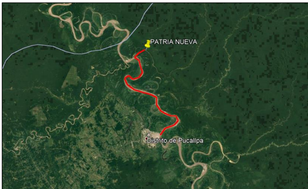
Fig. 03 – Se observa el 1er y 2do Recorrido, Pucallpa – Calleria.