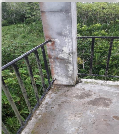
Fig. 07- Columna del tanque elevado existente

Columnas: se observa las siguientes patologías