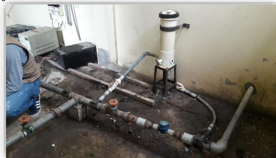
Fig. 09– Sistema de cloración existente

Sistema de Cloración-línea de impulsión (toma hidráulica): se observa las siguientes patologías.