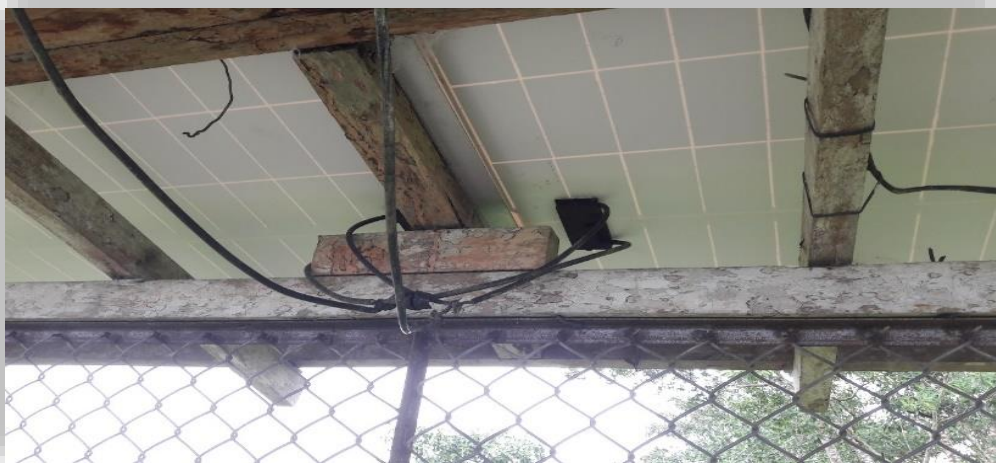
Fig. 05 – Estructura de madera de los paneles solares existente

El Panel solar, placa solar o modulo solar: se observa que sus instalaciones de los paneles fotovoltaicos presentan las siguientes dificultades.