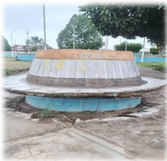
Refacción de sardinel, muro y bancas