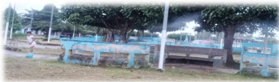
PINTADO DE LA PLAZA DE ARMAS