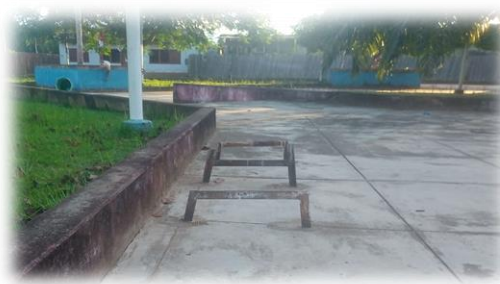
Instalación de bancas de madera