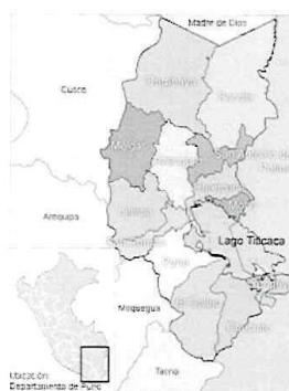
Ilustración 7: Mapa del departamento de Puno