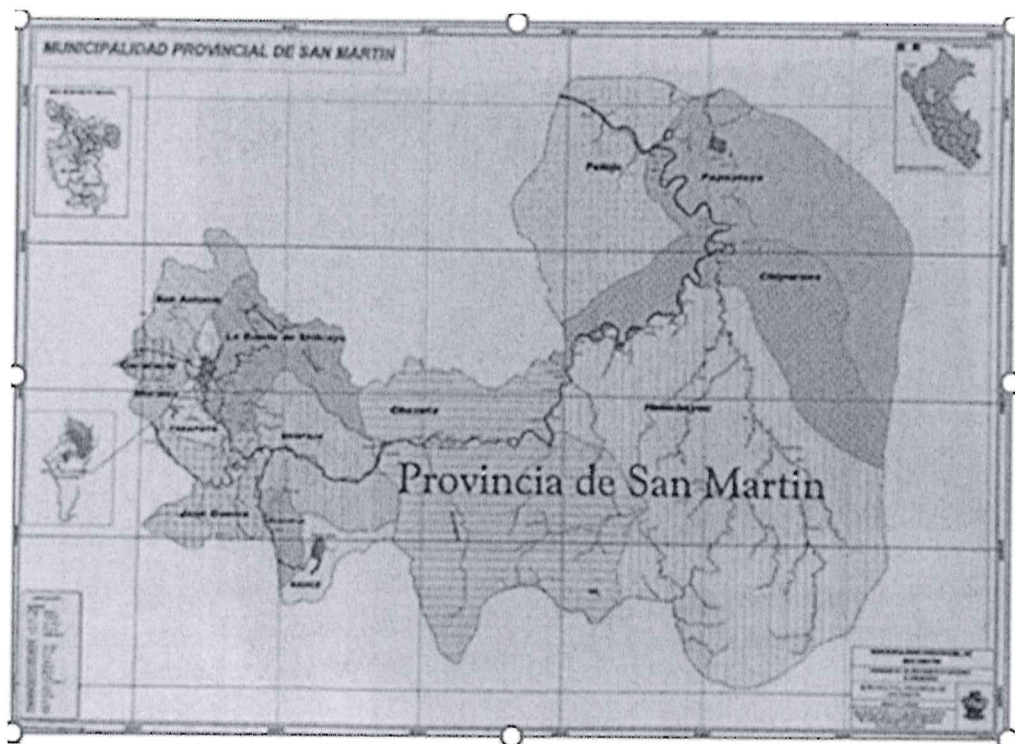
GRÁFICO N°03: MAPA DE UBICACIÓN DEL DISTRITO DE TARAPOTO.