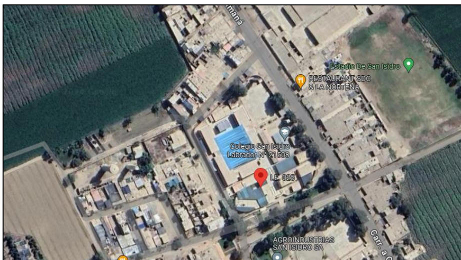
Ubicación de la zona del proyecto.