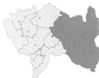
Distritos de la provincia de Satipo