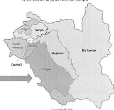
Viacatán del Ene