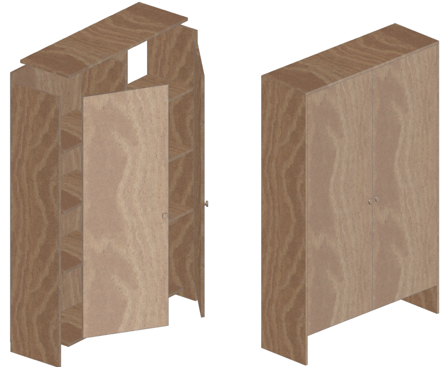
DETALLE DE UNIONES ESCALA 1:17.5