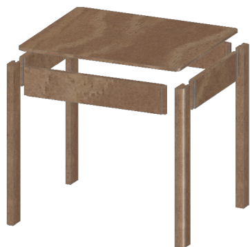
DETALLE DE UNIONES