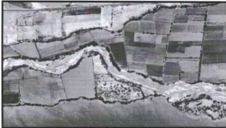
Figura N° 1: Mapa Ubicación Zona de Estudio