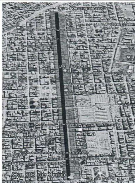
Imagen N°02: Ubicación satelital del área