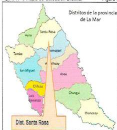
Figura N° 3 Mapa de Ubicación Distrital