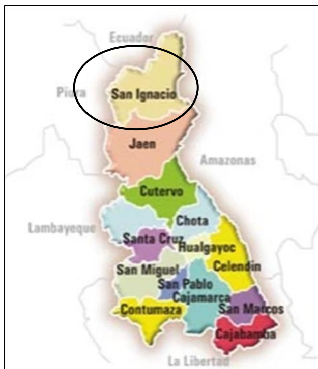
GRAFICO N° 03: LOCALIZACIÓN EN LA PROVINCIA