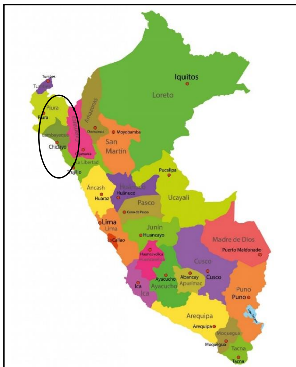
GRAFICO N° 02: LOCALIZACIÓN EN EL DEPARTAMENTO