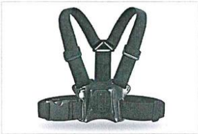
Imagen Referencial: Arnés de Pecho