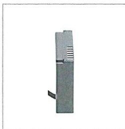
Imagen Referencial: Batería de Recambio