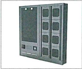
Imagen Referencial: Estación de Acople