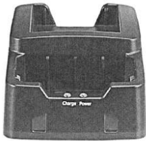
Imagen Referencial: Cargador de Batería

La estación de acople debe permitir la carga simultánea de cámaras corporales y la descarga automática de los datos de video grabados. Está diseñada para un entorno de seguridad intensivo, facilitando la gestión, recarga y transferencia de datos de hasta 32 cámaras corporales.