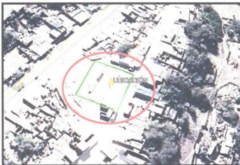
Imagen N° 01: Localización del Servicio.