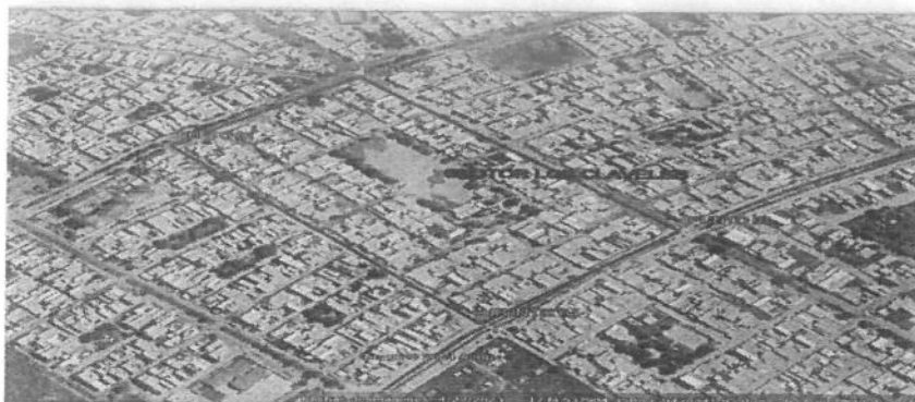
Imagen satelital del Sector Los Claveles en el distrito Veintiséis de Octubre

La zona proyectada limita por el norte con el A.H. Santa Rosa y el A.H San Martín, por el Sur Parque Ecológico Kurt Berr y el A.H. Villa Perú Canadá, por el este el A.H. Santa Julia y por el Oeste con A.H San Sebastián.