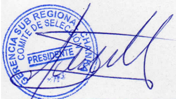
C.P.C FLOR ROSMERY TRUYENQUE QUISPE

El periodo de lances de acuerdo al calendario se llevó a cabo el día 27 de junio del 2023, una vez finalizado el periodo de lance el sistema procesa los lances recibidos, ordenado a los postores según el monto de su ultimo lance, estableciendo el orden de prelación de los postores, según al siguiente detalle: