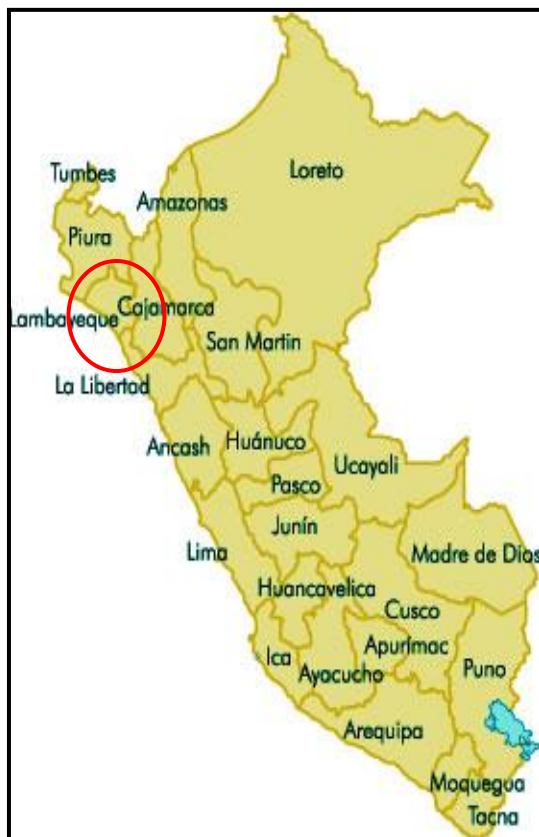
GRAFICO 02 LOCALIZACIÓN GRÁFICA DE LA PROVINCIA DE CHICLAYO