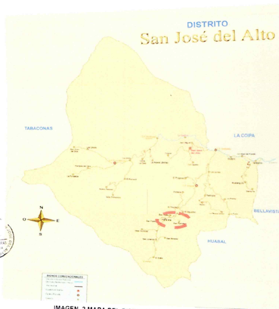
IMAGEN 2 MAPA DEL DISTRITO DE SAN JOSE DEL ALTO