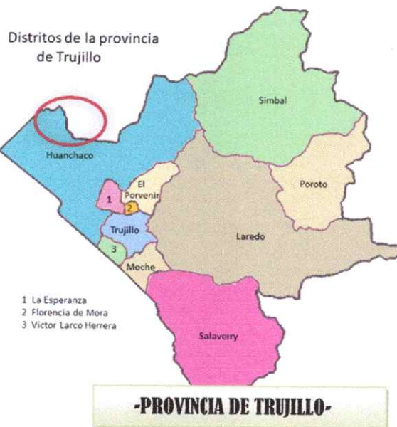
Ilustración 2. : Micro Localización del Proyecto