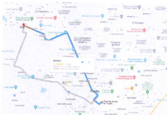
Imagen 1: Accesibilidad desde el centro histórico hasta el proyecto.