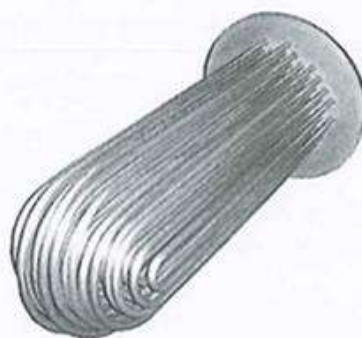
Serpentín o bayoneta calefactora de cobre para calentador de agua a vapor