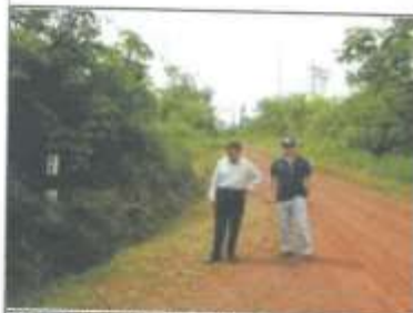
Foto 01: Kilómetro de Inicio (00+000 km.) de la Carretera Vecinal, Hito Kilométrico