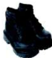
Zapato de seguridad Puntera Acero