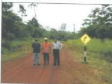
Foto 03: Señalización Preventiva.