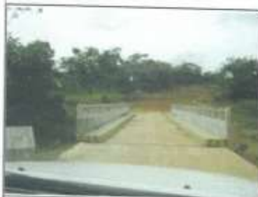
Foto 05: Puente de Concreto, en servicio. Con Plataforma, Veredas y Barandales en buen estado operativo.