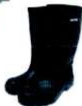
Bota de Jebe

Equipos de Protección Personal (EPPs) los cuales deberan ser remplazdos de acuerdo a la necesidad. En el caso de los cascos de proteccion estos deben cumplir con los requisitos de absorcion de impacto y resistencia a la penetracion el personal de mantenimiento debera usar cascos de color anaranjado, mientras que de los jefes de mantenimiento debera ser color azul.