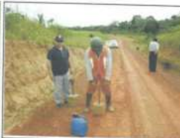
Foto 02: Compactación de Baches (Bacheo), en un Mantenimiento Rutinario.