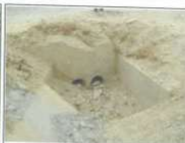
Foto 04: Ingreso de alcantarilla de desfogue en inicio de tramo, dos tuberías Ø 8" cada una. Cabezal de ingreso en malas condiciones y obstruido.