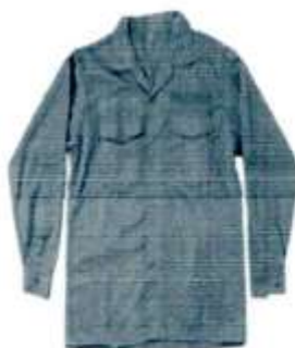
Uniforme de Mantenimiento