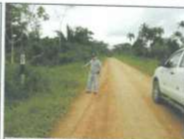
Foto 06: Hito Kilométrico (Señalización). Cercano al Final de la carretera.