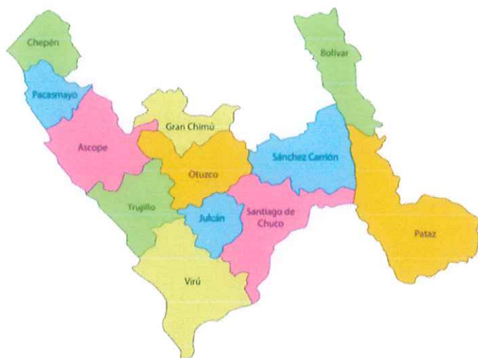
Figura N° 03: Ubicación de la provincia de Pacasmayo