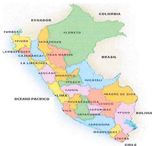
Imagen 01: Localización

Distrito : Jequetepeque Provincia : Pacasmayo Región : La Libertad