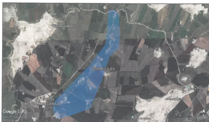
Imagen 01 - Vista satelital del Sector Carrizales.