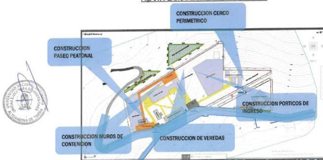
Fig. 01. PLANO PLANTEAMIENTO GENERAL