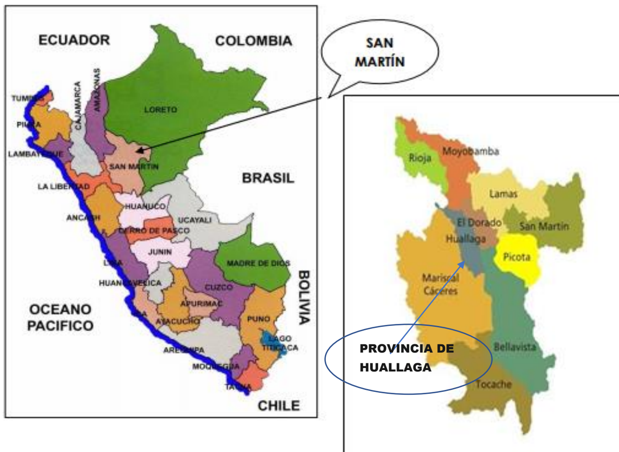
Imagen 01: Ubicación de San Martín, Huallaga, Alto Saposoa, Nueva Vida

Departamento : San Martín Provincia : Huallaga Distrito : Alto Saposoa Localidad : Nueva Vida Región Geográfica : Selva Jurisdicción : UGEL - Huallaga.