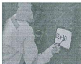
Imagen referencial N°01

Se pintará las progresivas de fondo color blanco, letras color negro, y escritura de la siguiente manera por ejemplo 02+300.