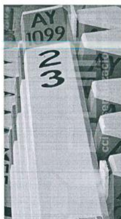
Imagen referencial N°02

Se pintará los hitos kilométricos de fondo color blanco, letras color negro y color cabezal naranja.