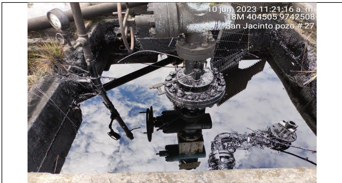
Foto 1: Cellar del pozo SANJ-27