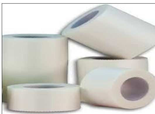
Fig. 1 (No incluye diseño)