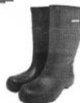
Bota de Jebe

Equipos de Protección Personal (EPPs) los cuales deberán ser remplazados de acuerdo a la necesidad. En el caso de los cascos de protección estos deben cumplir con los requisitos de absorción de impacto y resistencia a la penetración el personal de mantenimiento deberá usar cascos de color anaranjado, mientras que de los jefes de mantenimiento deberá ser color azul.