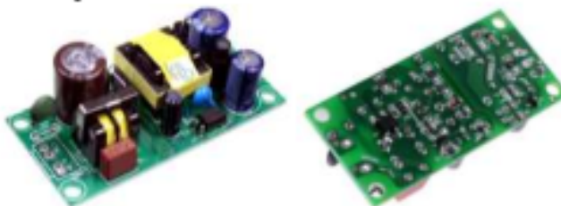
Imagen referencial N°12: Fuente de alimentación DC 220VAC