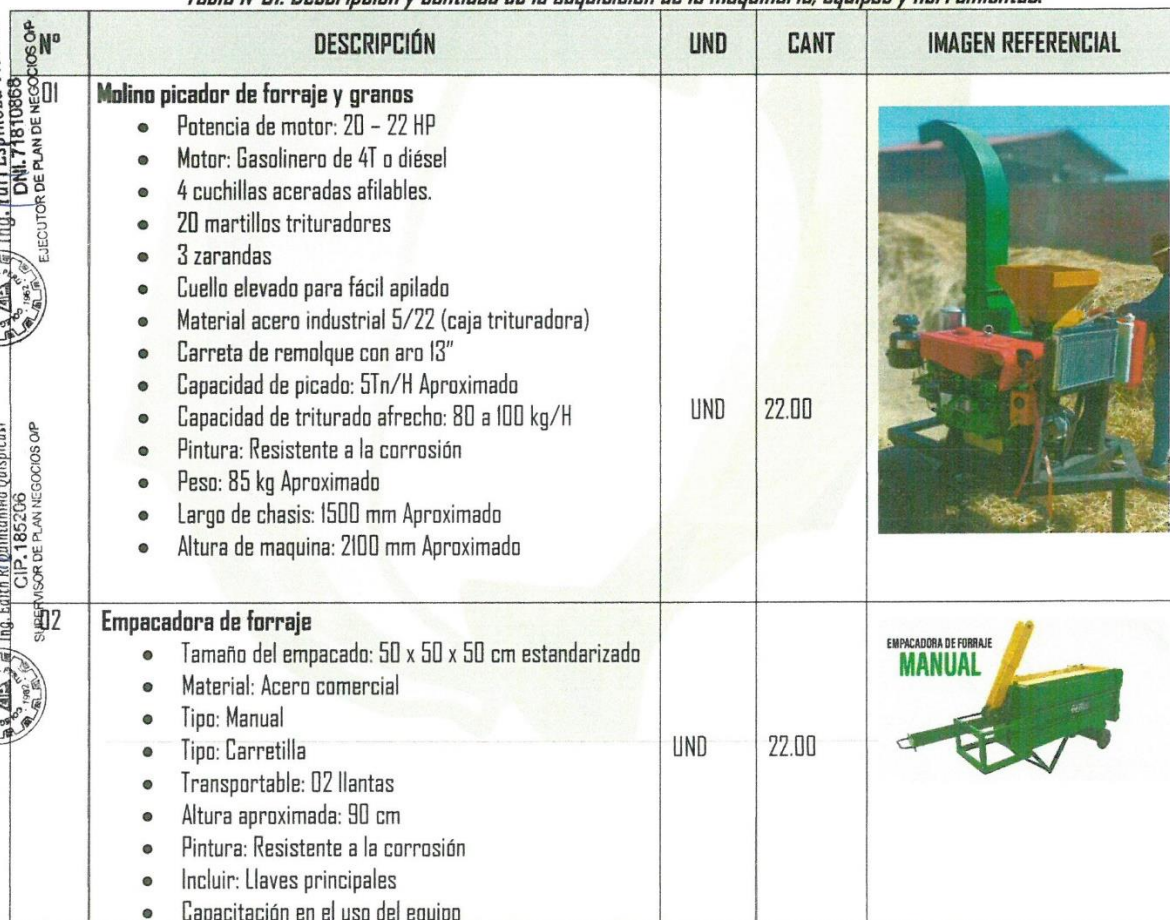
Tabla Nº01: Descripción y cantidad de la adquisición de la maquinaria, equipos y herramientas.

Plaza de Armas S/N. Challhuahuacho - Cotabambas - Apurímac