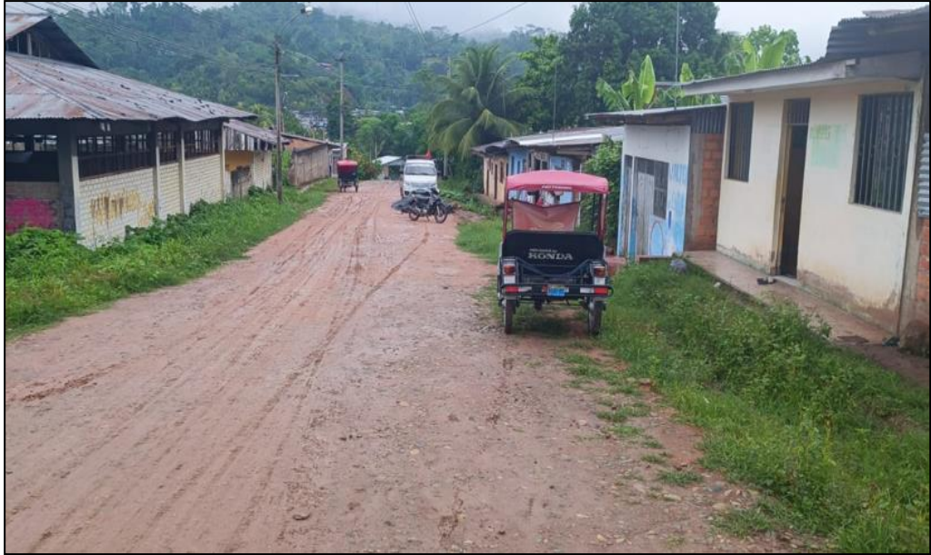
Jr. La selva C-02.

Las veredas existentes han sido construidas de manera artesanal por los propietarios de los predios, tal como se puede observar en la presente imagen.