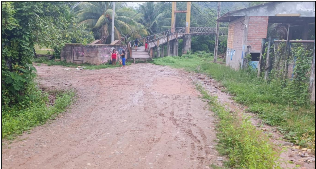
Jr. La selva C-03.

El presente jirón no cuenta con veredas los que genera un peligro latente para los propietarios y vecinos que circulan por el lugar tal como se puede observar en la siguiente imagen.