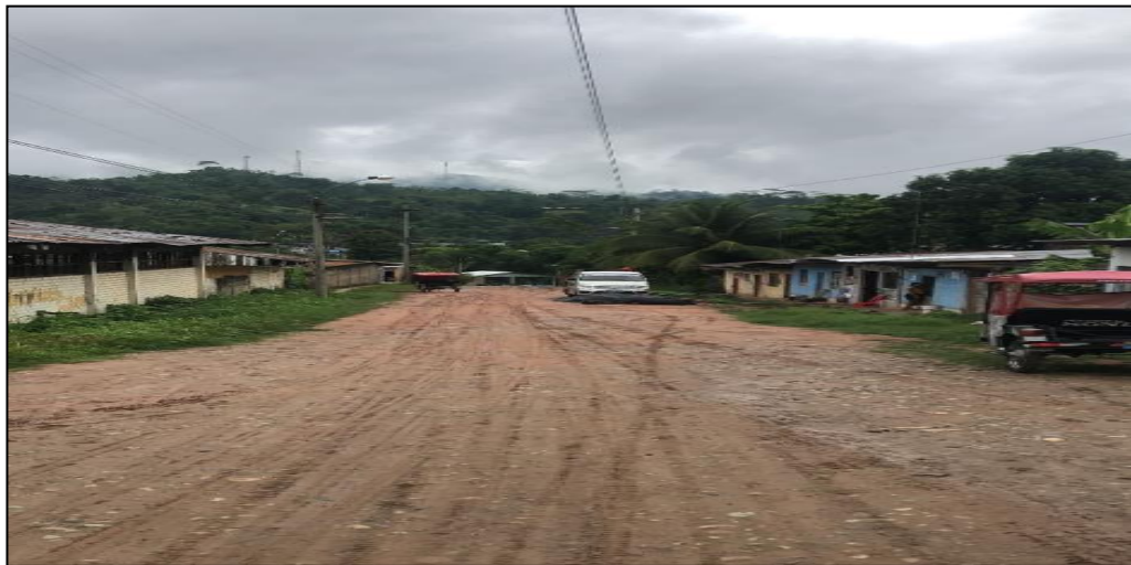
Jr. La selva C-02.

La evacuación de las aguas de lluvias se da mediante las zanjas y drenajes naturales que se han formado por las constantes lluvias, ya que estas representan focos infecciosos, ya que en varias épocas del año se empoza el agua lo cual estos son potenciales criaderos de zancudos.