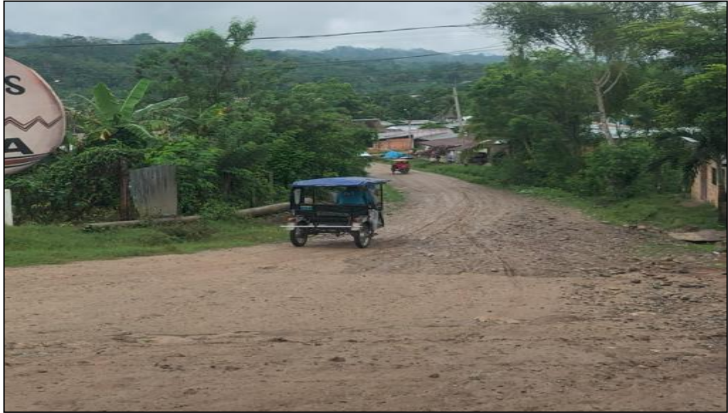
Av. Banda de Chazuta C-01.

La evacuación de las aguas de lluvias se da mediante las zanjas y drenajes naturales que se han formado por las constantes lluvias, ya que estas representan focos infecciosos, ya que en varias épocas del año se empoza el agua lo cual estos son potenciales criaderos de zancudos.