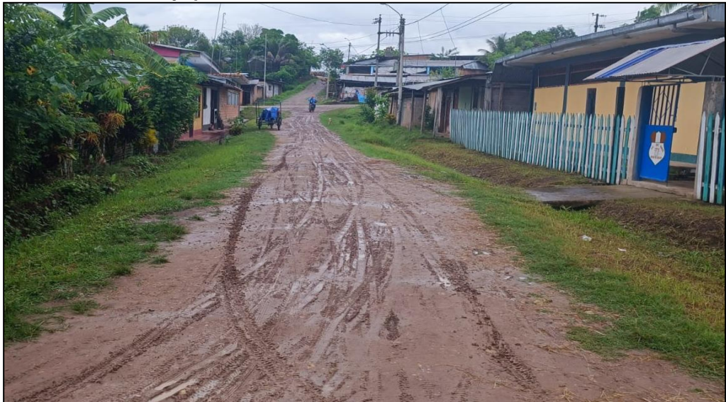
Jr. La selva C-02.

Las veredas existentes han sido construidas de manera artesanal por los propietarios de los predios, tal como se puede observar en la presente imagen.