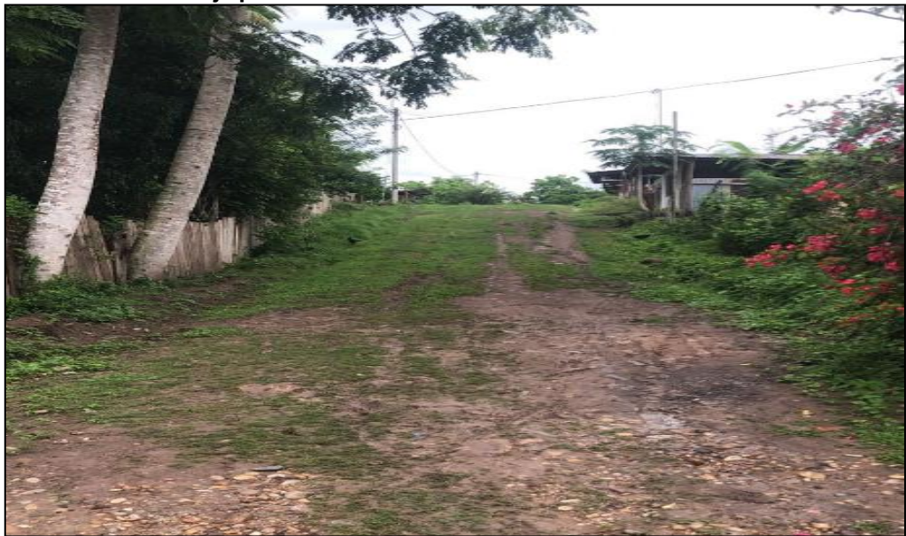
Jr. Huaynacapac C-02.

Las veredas existentes han sido construidas de manera artesanal por los propietarios de los predios, tal como se puede observar en la presente imagen.