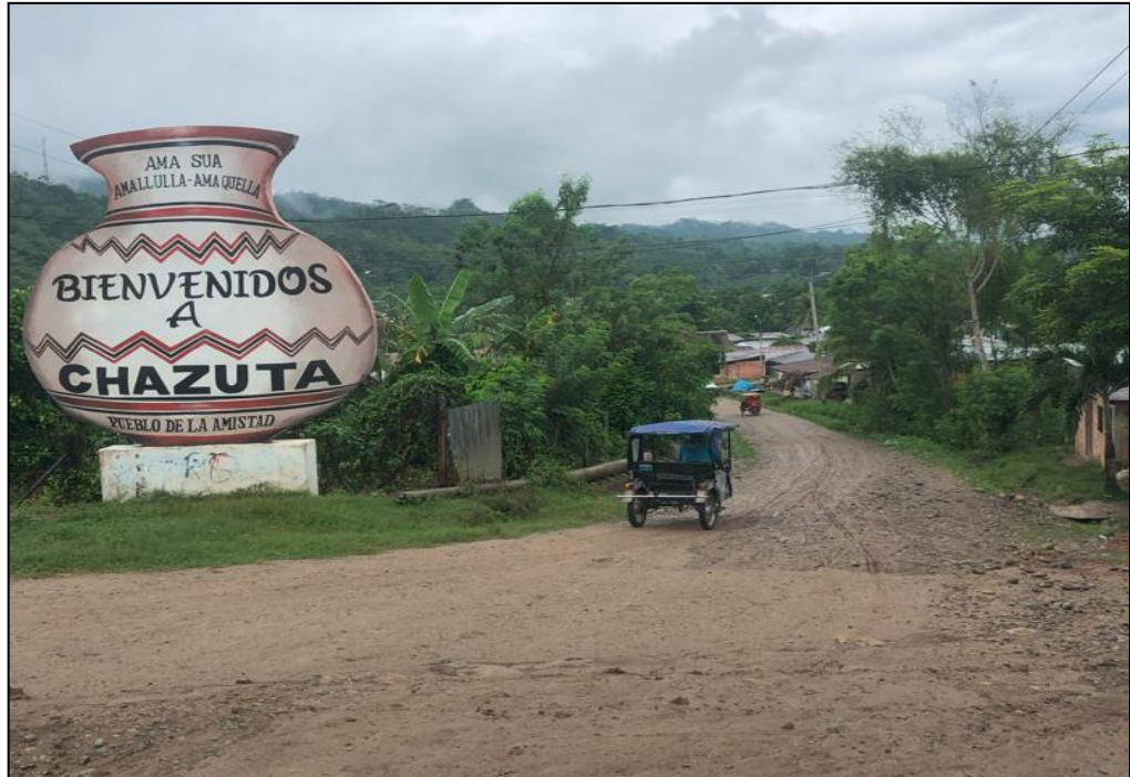
Av. Banda de Chazuta C-01.

mal estado ya que suman aproximadamente el 95% de calles que no cuentan con un tratamiento integral de vías, ni veredas, ni evacuación de aguas pluviales, la falta de mantenimiento generan restricciones del tránsito vehicular y peatonal, lo que obliga a la población a improvisar caminos de madera para efectuar recorridos a pie, con la finalidad de acceder al servicios transporte y a través de estos desarrollar sus actividades diarias. Las condiciones de salubridad en las vías públicas son deplorables, se describe: