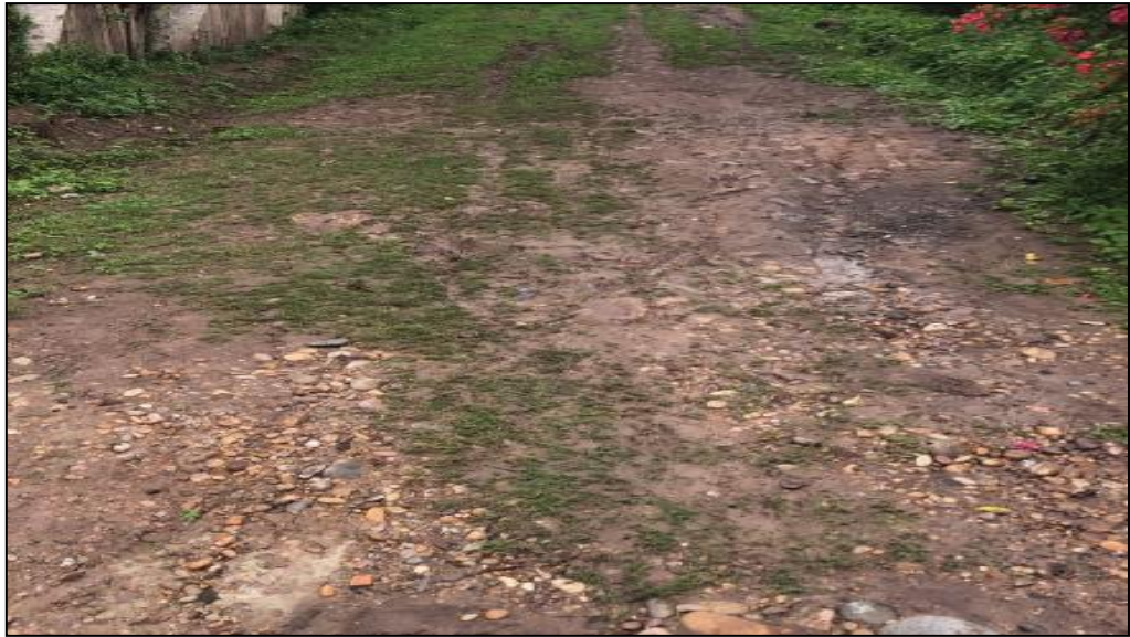
Jr. Huaynacapac C-02.

Las veredas existentes han sido construidas de manera artesanal por los propietarios de los predios, tal como se puede observar en la presente imagen.