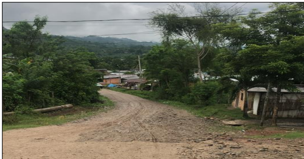
Av. Banda de Chazuta C-01.

El presente jirón se encuentra a nivel de afirmado, el cual no se encuentra en buen estado debido a las constantes lluvias y paso de los vehículos livianos y pesados, así mismo este genera contaminación con polvo a los vecinos y transeúntes en general.