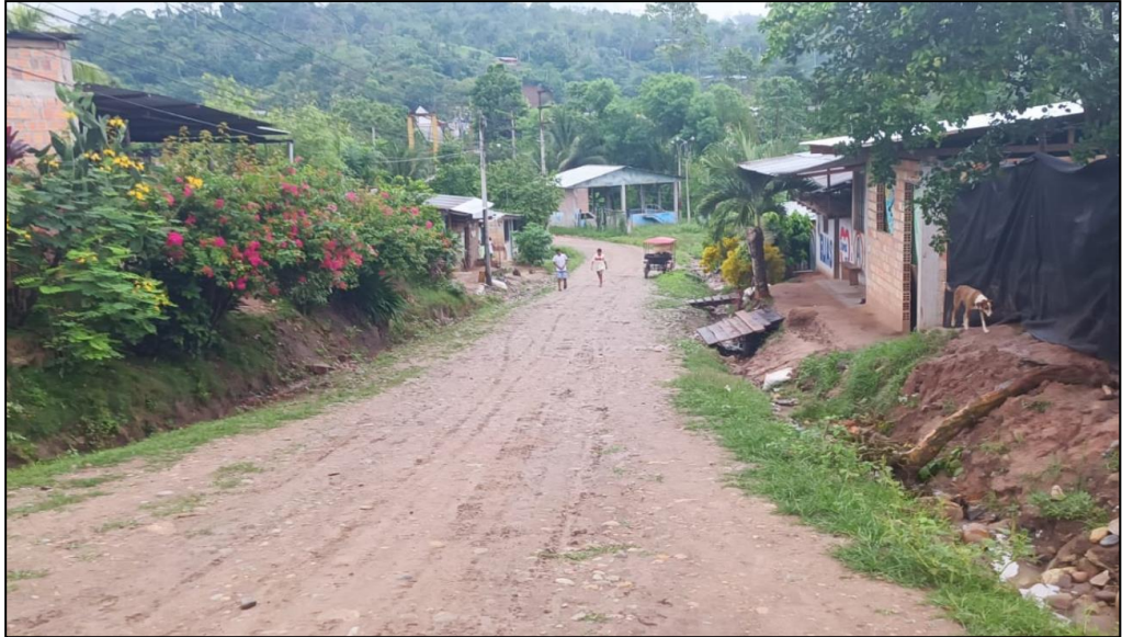
Jr. La selva C-03.

El presente jirón no cuenta con veredas los que genera un peligro latente para los propietarios y vecinos que circulan por el lugar tal como se puede observar en la siguiente imagen.