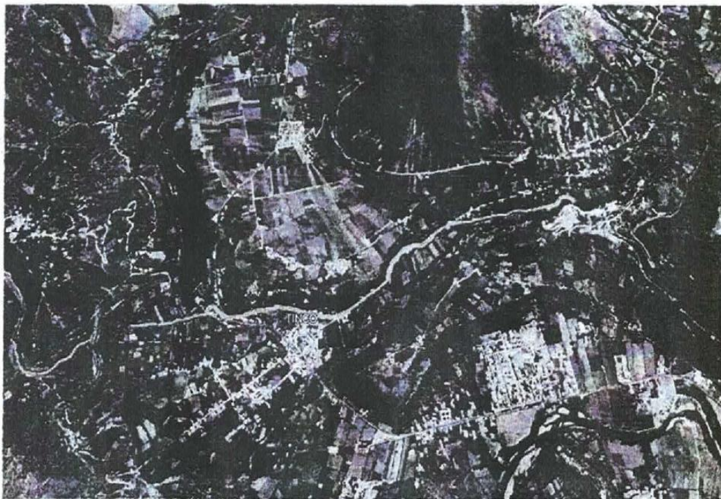
Fotografía N°01: El Sector de la localidad de tinco.