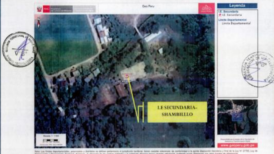
Ilustración 1. Vista Satelital de la Ubicación de la IE en el Centro poblado Shambillo.