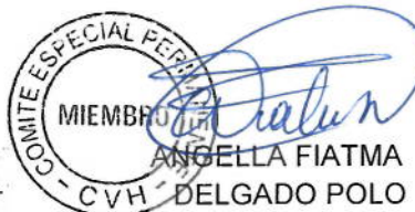
ANGELLA FIATMA DELGADO POLO