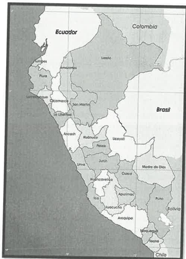
Mapa de macro localización del Perú