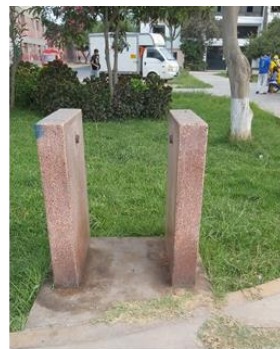
FALTA DE CONTENEDORES DE RESIDUOS SOLIDOS