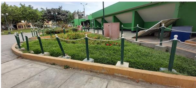
DETERIORO DE SARDINELES PERALTADOS