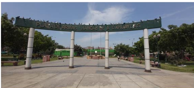
ARCO EXISTENTE , PRESENTA DETERIORO DE LA PINTURA, FALTA DE LAS LETRAS