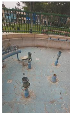
ABANDONO DE LA PILETA EXISTENTE