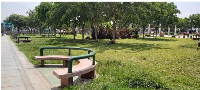
PERSONAS SENTADAS EN LAS AREAS VERDES DEJANDO DE LADO LAS BANCAS