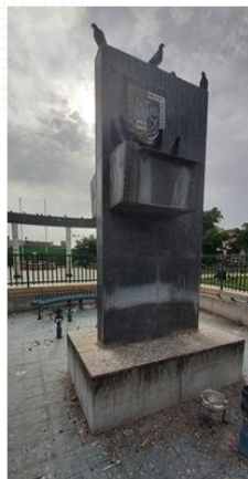
ABANDONO DE LA PILETA EXISTENTE