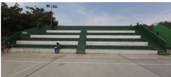
GRADERIAS EXISTENTES , PRESENTA DETERIORO DE LA PINTURA