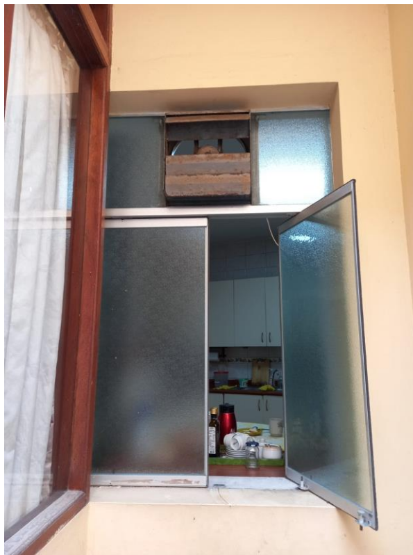
Vista Exterior de la ventana