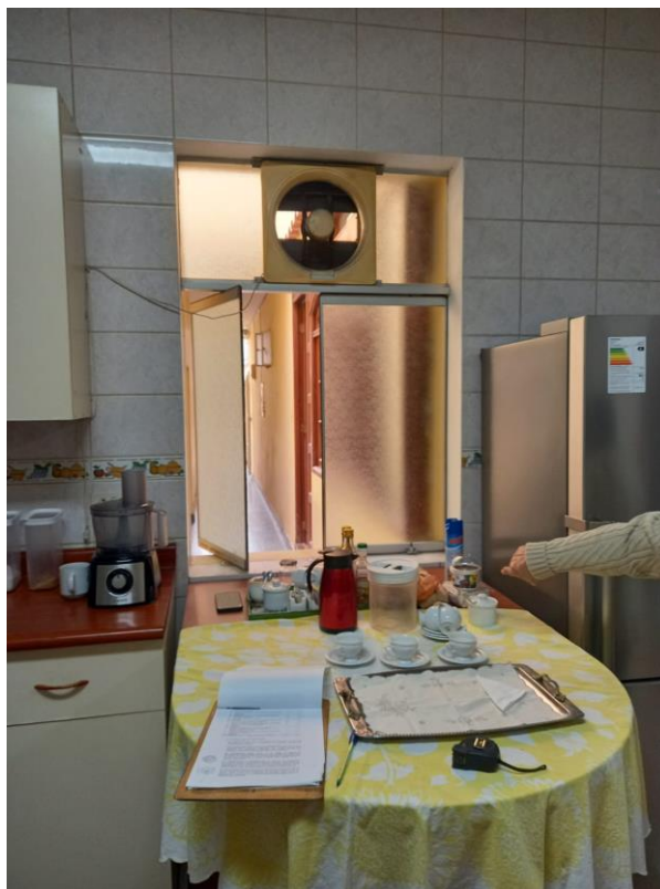
Ventana que se debe modificar